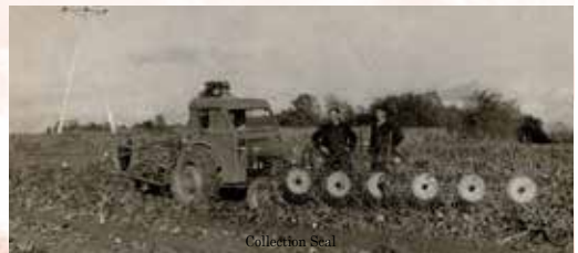
Arrachage des betteraves en 1962 dans le champ de «La Cerisière». Le Massey Harris est attelé à l'andaineuse en tête pour dégager les feuilles et l'arracheuse derrière.