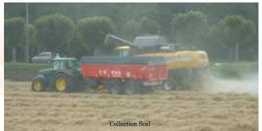
La moisson dans le «Plat Cul» en juillet 2011.