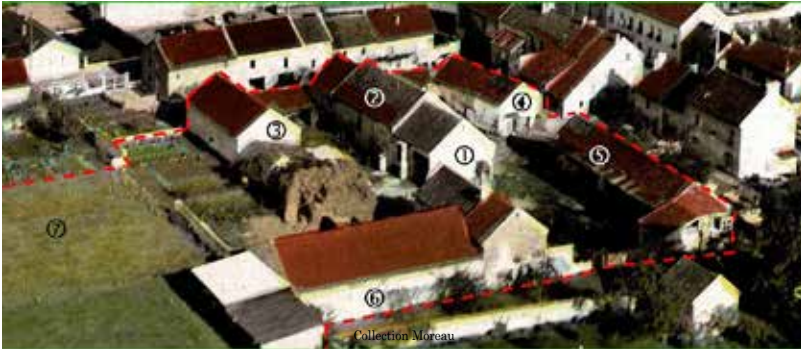
La ferme vue d'avion vers 1960 (délimitée par les pointillés rouges). 1. La maison. 2. Etable et écurie. 3. Grange à fourrage. 4. 2ème étable. 5. Hangar, clapiers et cave. 6. Vieux hangar. 7. Pré.

coupe. Mais, ensuite, il fallut rembourser l'emprunt. Ce fut dur et Roger dut vendre une partie de sa réserve de foin pour faire face. Mais quel changement ! Enfin autonome, Roger moissonne dans de bien meilleures conditions.