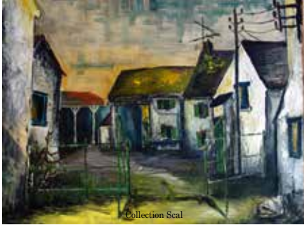
Entrée de la ferme croquée par un certain P. Brice qui y avait posé son chevalet vers 1970.