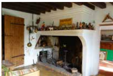
La même prise de vue après restauration.

par de la tomette carrée de couleur ocre. Dans le coin opposé à la cheminée, entre la porte d'entrée et la porte de l'étable (voir plan), un évier en grès a été conservé. Il n'y avait pas l'eau courante, donc pas de robinetterie : on amenait l'eau du puits avec un seau pour faire la vaisselle ou laver les légumes. En revanche,