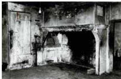
La cheminée, le four à pain et la porte ouvrant sur l'escalier avant les travaux de restauration.

A l'origine, des dalles de pierres de toutes dimensions couvraient le sol. Beaucoup étaient irrécupérables : au droit de la cheminée elles étaient cassées car on y avait fendu du bois avant de le mettre dans l'âtre. Maintenant, les dalles ont été remplacées