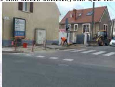
Réfection du trottoir et aménagement du passage piéton à l'angle de la rue du Bourreau et de l'avenue des Américains.