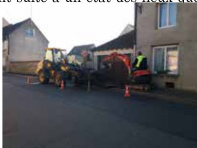
Les travaux près du 56, rue Victor Clairét.

Ils font suite à un état des lieux que nous