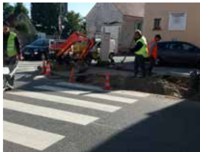
Aménagement du passage piéton près de la pharmacie.