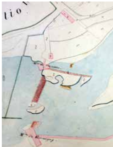
Extrait du plan cadastral de Varreddes de 1829. En rose, l'emprise de chaque moulin et les aménagements en amont de chaque moulin. En rouge, les retenues d'eau (barrages) et la digue le long de l'île du Moulin. En vert, la limite territoriale entre Varreddes et Germigny.

Enfin, il fallait du grain à moudre. Cela paraît évident, mais, les années de disette, le meunier avait bien peu de travail. Même les bonnes années, les rendements en blé