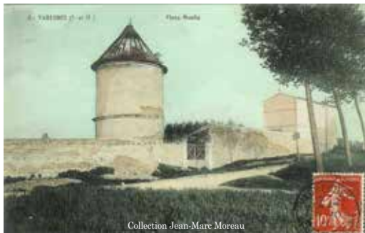
Le vieux moulin vers 1900, vu de la route de Germigny.

Depuis le milieu du XIXe siècle, les roues du moulin de Varredes sur la Marne sont enlevées. Seul, un pan de mur (angle de bâtisse ou support d'un tourillon d'essieu) érige sa ruine sur l'île dite du Mou-