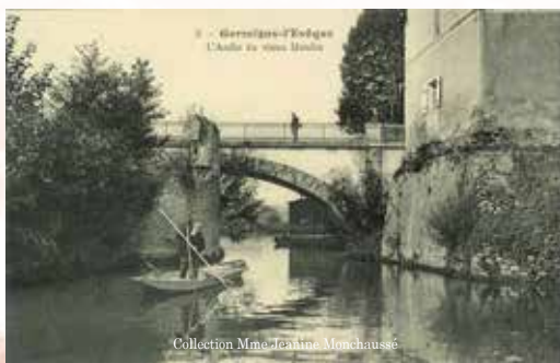
Le moulin de Varredes vers 1900. A gauche, sur l'île du Moulin, le pan de mur qui supportait la roue et le moulin. A droite sur la rive, le bas de l'ancien moulin. Au fond, l'arche du pont.