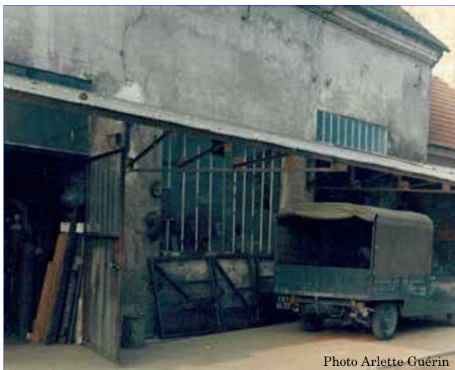
Le devant de la forge et la Peugeot 403 bâchée.