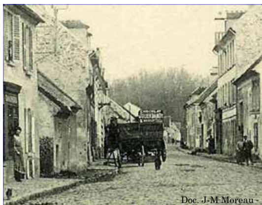
Doc. J-M Moreau

Bien sûr, au début du 20 ème siècle, il y a