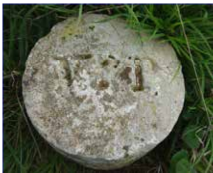
Une borne délimitant les emprises du canal de l'Ourcq. Sur le dessus, sont gravées les lettres VdP pour "Ville de Paris".