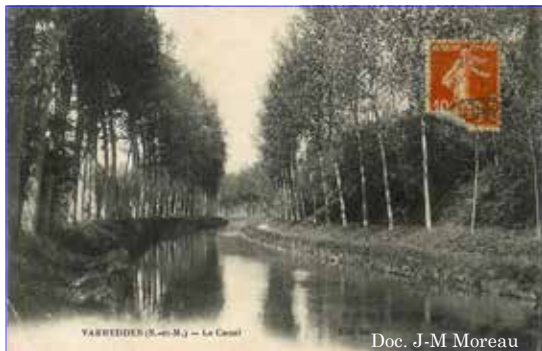
Le canal de l'Ourcq à Varreddes vers 1900.

Source historique : Jacques de La Garde - "Les Canaux de l'Ourcq - Itinéraires touristiques". Edition SAUVEGARDE DES MONUMENTS 77390 GUIGNES - 1991.