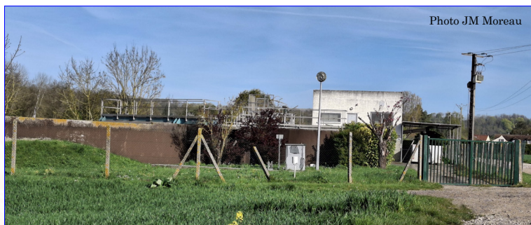
La station d'épuration à l'heure actuelle, implantée au coin du chemin des Buttes et du chemin d'Avoine, lieu-dit « La Plaine du Plat-Cul. »

qui fera d'ailleurs l'objet d'une réfection complète et une partie de la rue de l'Eglise. La construction de la station d'épuration est aussi entreprise. Tous ces travaux coûtent fort cher et mettent souvent à mal les finances de la commune. On recourt plu-