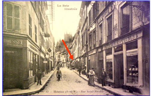
La droguerie, repérée par la flèche, se trouvait rue Saint-Nicolas, aujourd'hui rue du Général Leclerc.